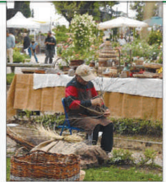
Tante novità Fiori e arredo per il giardino

a orchidee, piante acquatiche, pelargoni, olivi secolari e piante perenni, senza dimenticare le numerose varietà di agrumi, le immancabili piante cactacee e succulente, ma anche carnivore, tilandsie, peonie, bulbi e mediterranee. Tantissime le novità e le rarità, come la nuova rosa Anna