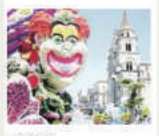
ACIREALE Da domani a domenica la "Festa dei fiori" con i famosi carri allegorici ricoperti di garofani