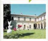
FRANCIACORTA A Bornato (Brescia) dal 18 al 20 maggio rose ed erbacee perenni per "Franciacorta in fiore"