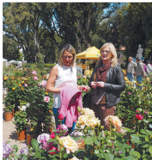
Tornano a fiorire i Giardini del Frontone Perugia Flower Show, ieri l'apertura e durerà fino a domani