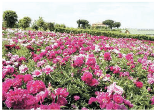
COLLINE IN FIORE A sinistra, lo spettacolo delle peonie del Centro botanico Mouton a Vitorchiano (Viterbo). Sotto, l'Auditorium invaso da piante e fiori per l'edizione 2017 del Festival del Verde e del Paesaggio

EDERE E NARCISI Infine, nel Lazio, una visita da non mancare assolutamente è quella al Centro Botanico Mouton a Vitorchiano, in provincia di Viterbo, dove all'interno di un rigoglioso giardino di 15 quinti ettari, circondato da lecci, cipressi, querce e ulivi secolari, è possibile ammirare fino alla fine di maggio tutte le varietà di peonie cinesi esistenti sul pianeta. Sono circa 250 mila piante, di 600 differenti varietà. Un luogo unico al mondo. E ancora, per i pollici verdi, da segnalare questo week end l'Arezzo Flower Show: rarità botaniche, antiche