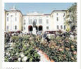
MILANO Appuntamento dall'11 al 13 maggio ai giardini Indro Montanelli con l'evento florovivaistico Orticola